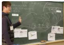
ビオトープを作る前に、生き物の暮らしについて学びます。