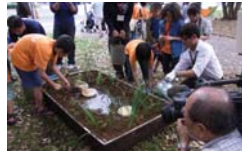
生き物の生態を知り、暮らしをイメージしながらビオトープをつくっていきます。