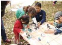
川や池に住む微生物を知る。真刺に顕微鏡を覗き込む子ども。